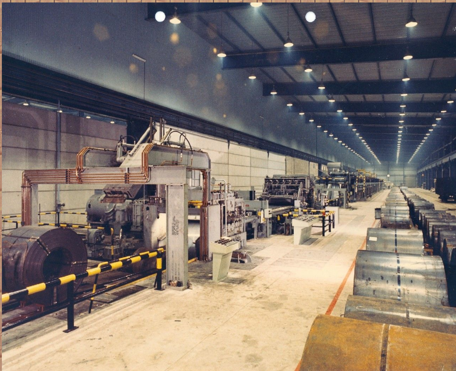
Vue de la halle Die Hallenansicht