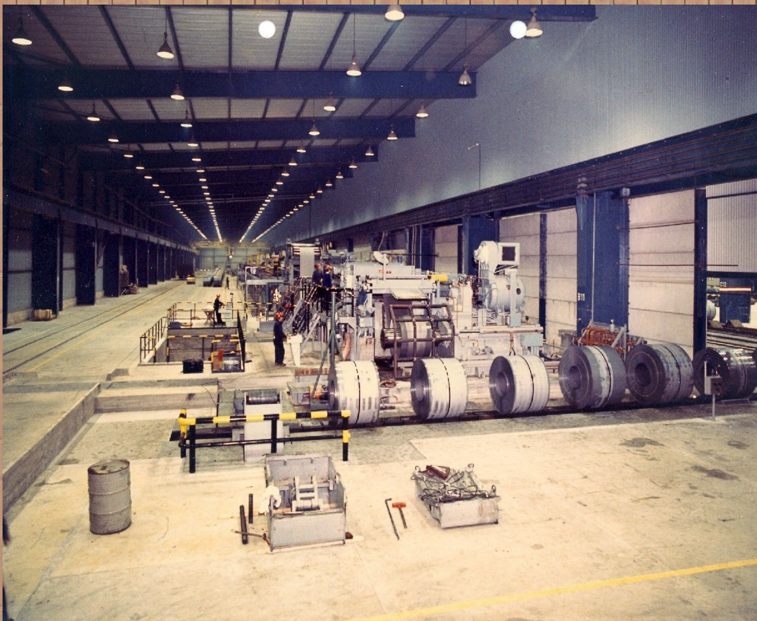
Vue de la halle Die Hallenansicht