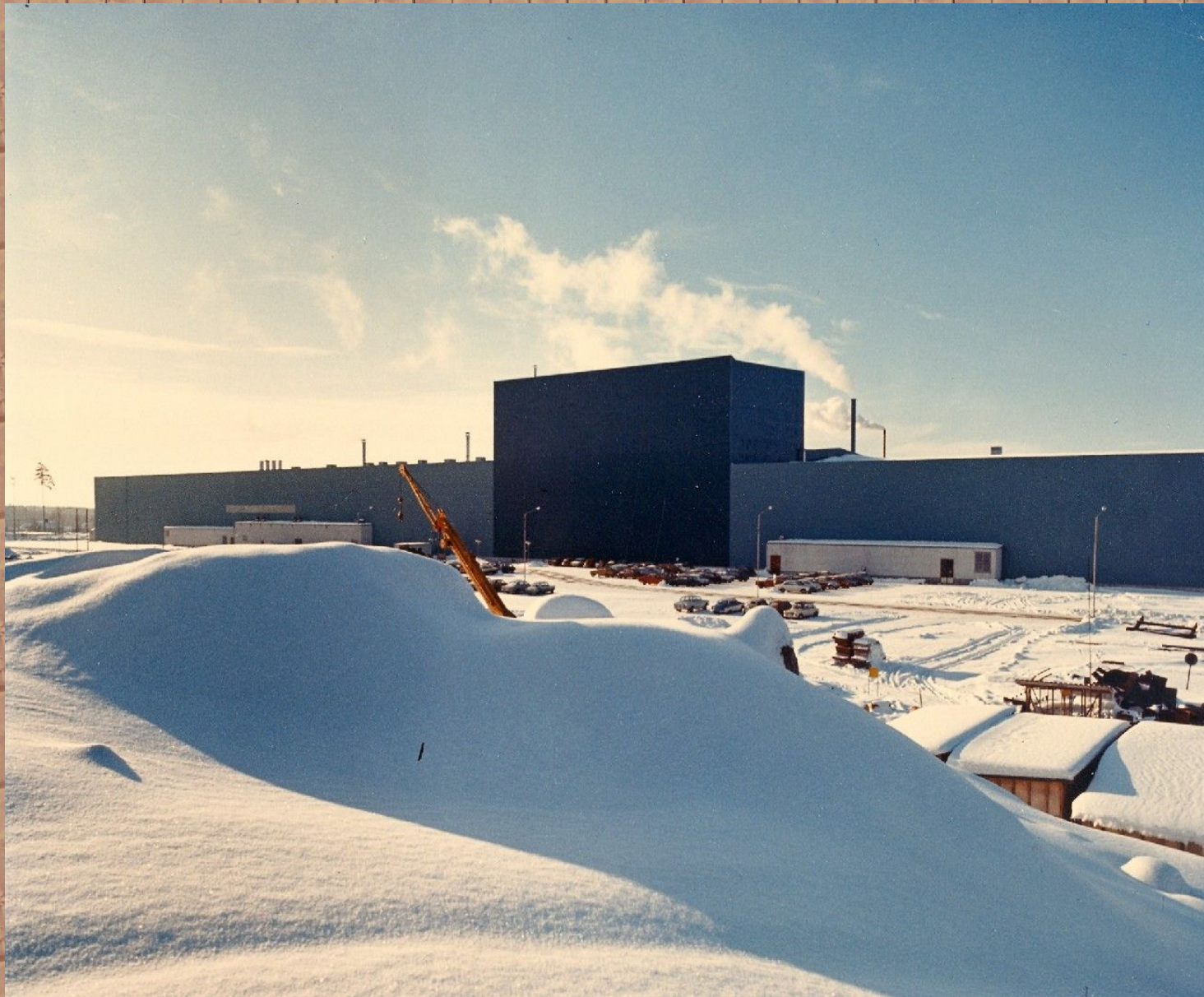
Vue de l'extérieur Die Aussenansicht